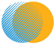
Table ronde sur le harcèlement en milieu scolaire